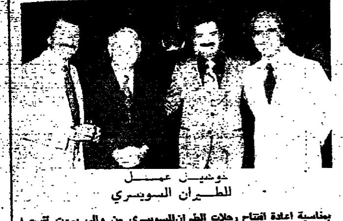
خوسيه عسل للطيران السوري

بنفسه اعاد افتتاح رحلات الطيران السوري من والى بيروت التي لن تفتقر لكاركون حلة كوكبيل عمل مديتها لثقة من رجال السلك الدبلوماسي... اخبار الناس